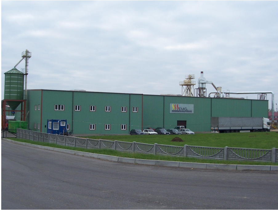
Ekologiczne Materiały Grzewcze Sp. z o.o.

Na terenie miejscowości znajduje się wiele podmiotów handlowych wszystkich branż, 2 stacje paliw, 3 zakłady mechaniki pojazdowej, 2 piekarnie, restauracja, 2 lokale gastronomiczne.