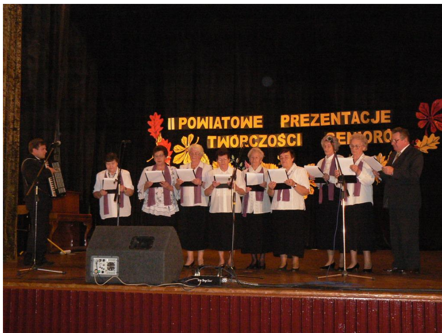
Występ Klubu Seniora z Szepietowa