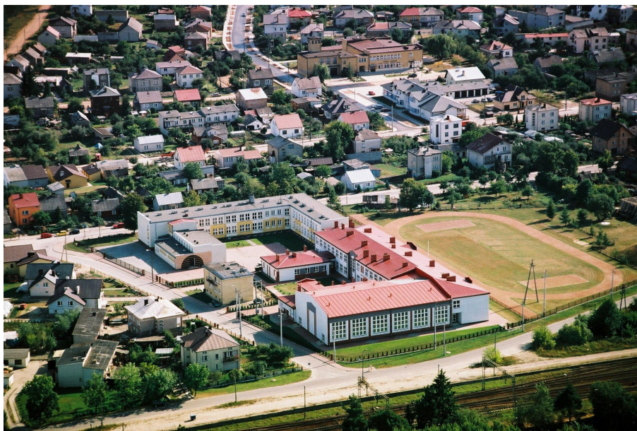
Szkoła Podstawowa i Publiczne Gimnazjum w Szepietowie

i młodzież mają możliwość poszerzania wiedzy w poszczególnych dziedzinach nauki.