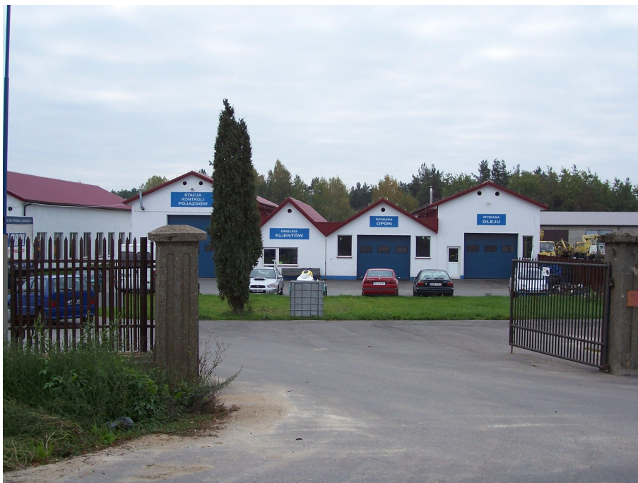
Zakład Mechaniki Pojazdowej „KONKRET” w Szepietowie

Na terenie miejscowości znajduje się wiele podmiotów handlowych wszystkich branż, 2 stacje paliw, 3 zakłady mechaniki pojazdowej, 2 piekarnie, restauracja, 2 lokale gastronomiczne.