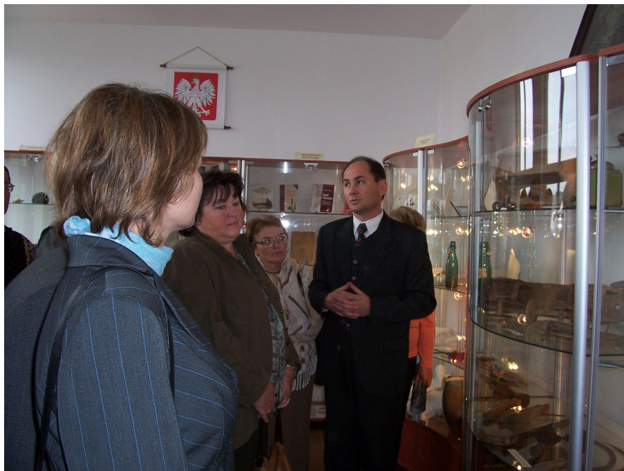
Izba Tradycji Regionalno – Historycznej w Szepietowie

W ostatnim czasie w GOK-u została otwarta Izba Tradycji Regionalno – Historycznej, której celem jest zachowanie i pielęgnowanie pamięci o bogatej historii i tradycji Szepietowa i okolic.