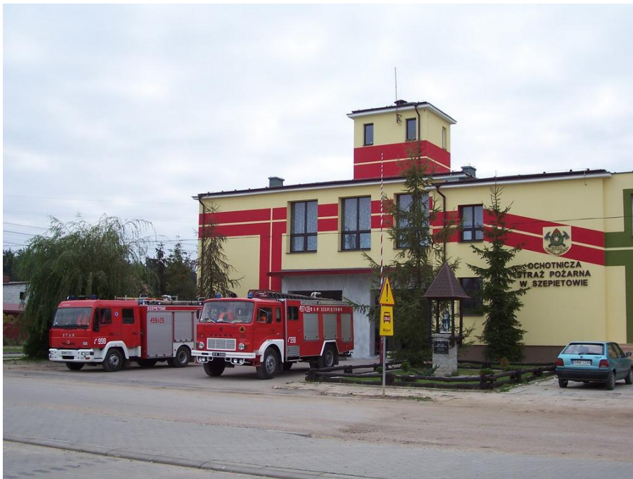
Ochołnicza Straż Pożarna w Szepietowie

Zarówno placówki oświatowe jak i jednostka kultury są bardzo okazałe. Publiczne Gimnazjum jest jedną z okazalszych i najlepiej wyposażonych placówek w województwie. Posiada piękną, pełnowymiarową halę sportową i kompleks boisk.