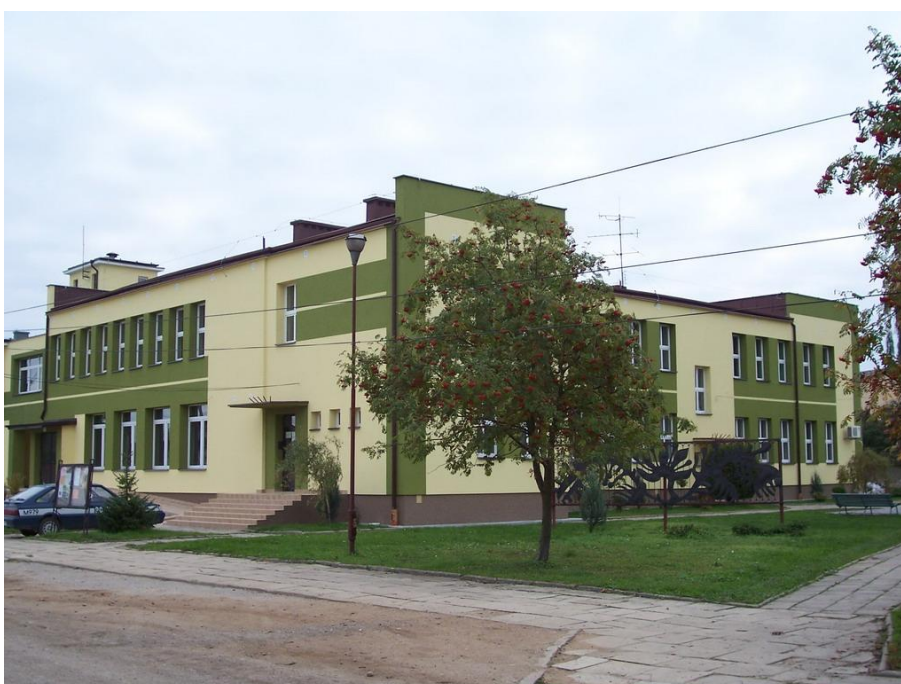
Gminny Ośrodek Kultury w Szepietowie

W Szepietowie znajduje się jednostka Ochotniczej Straży Pożarnej, włączona do Krajowego Systemu Ratownictwa Gaśniczego. Jest to jedna z najlepiej wyposażonych i funkcjonujących jednostek OSP w województwie.