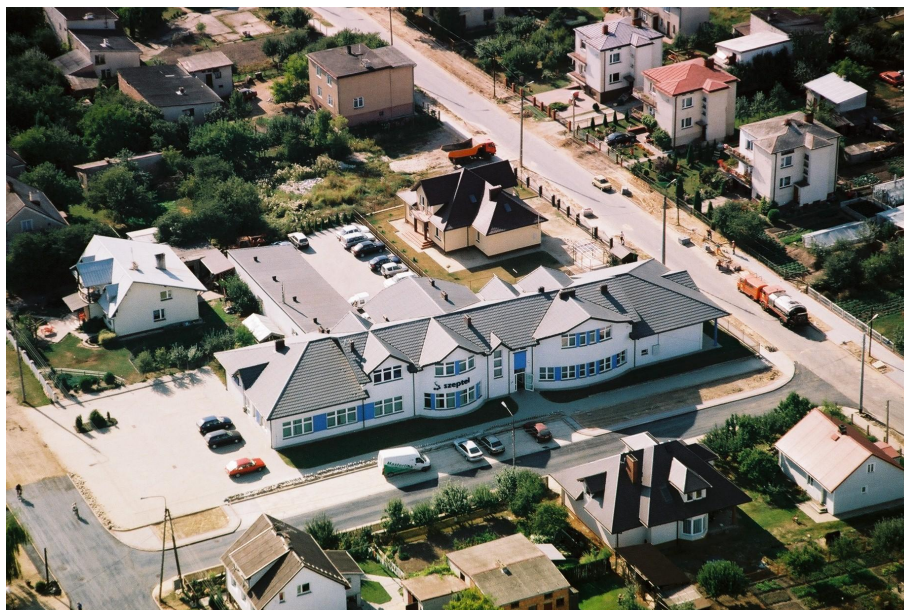
MNI Telecom S.A. w Szepietowie