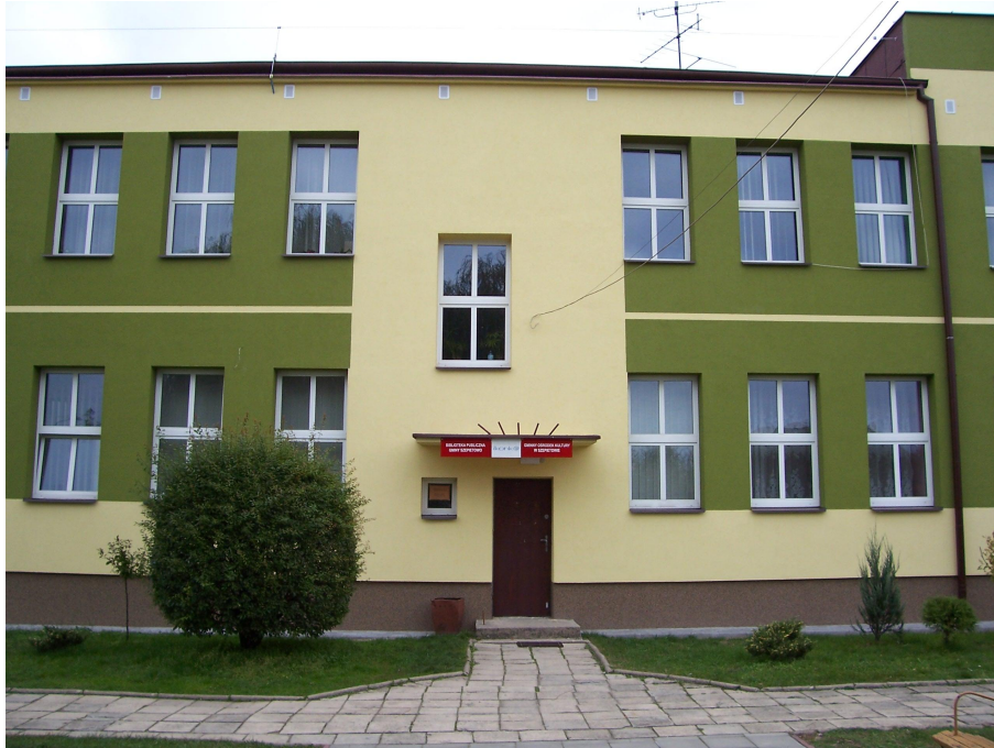
Gminny Ośrodek Kultury w Szepietowie

Co roku organizowanych jest wiele imprez, z czego duża część ma charakter ponadlokalny. Do najważniejszych można zaliczyć „Powiatową Biesiadę Rodzin Muzykujących”, „Powiatowy Przegląd Zespołów Scholi” oraz „Powiatowy Przegląd Orkiestr Dętych”. Zorganizowane są też stałe zajęcia dla dzieci i młodzieży. W Gminnym Ośrodku Kultury działa kółko plastyczne, orkiestra dęta, zespół wokalny oraz Zespół Pieśni i Tańca „Podlasie”.