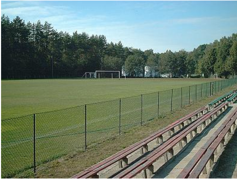
Stadion sportowy w Szepietowie

W rozgrywkach Podlaskiej Klasy Okręgowej Seniorów bierze udział drużyna piłkarska Sparta 1951 Szepietowo. Klub daje możliwość uzdolnionej sportowo młodzieży z Szepietowa i okolic podnoszenia umiejętności i uczestnictwa w sportowej rywalizacji.