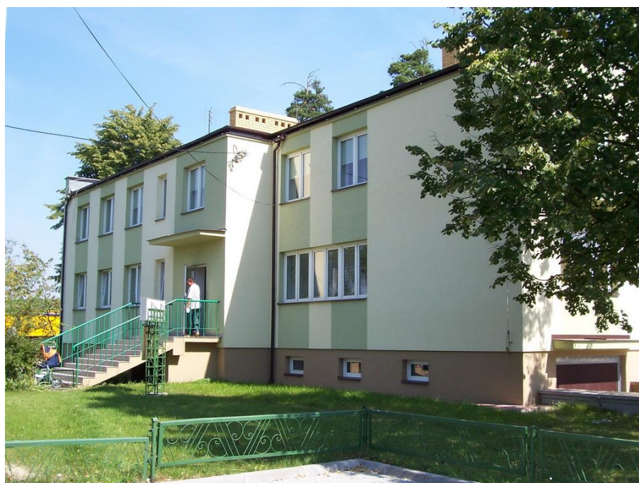
Ośrodek Zdrowia w Szepietowie