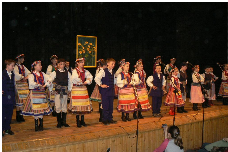
Zespół Pieśni i Tańca „Podlasie” przy GOK w Szepietowie

Dzieci i młodzież uczestnicząca w wymienionych zajęciach bierze udział w licznych imprezach i konkursach o charakterze ponadlokalnym (także międzynarodowym), zdobywając w nich niejednokrotnie czołowe miejsca i wyróżnienia.