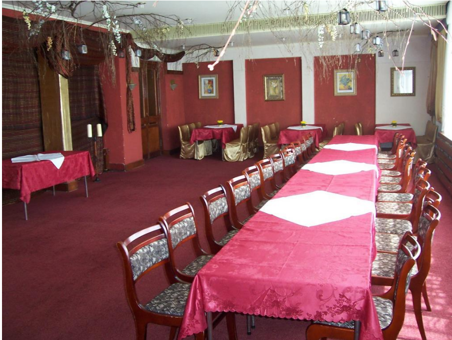
Wnętrze restauracji „Słowiańska” w Szepietowie

Bardzo dobre położenie komunikacyjne, zarówno drogowe jak i kolejowe, dobrze rozwinięta infrastruktura techniczno-komunalna, opracowywane plany zagospodarowania przestrzennego (termin uchwalenia II kw. 2009 r.) zabezpieczające nowe tereny pod rozbudowę zapewniają warunki do rozwoju miejscowości. W Szepietowie działa wiele podmiotów o charakterze miastotwórczym.