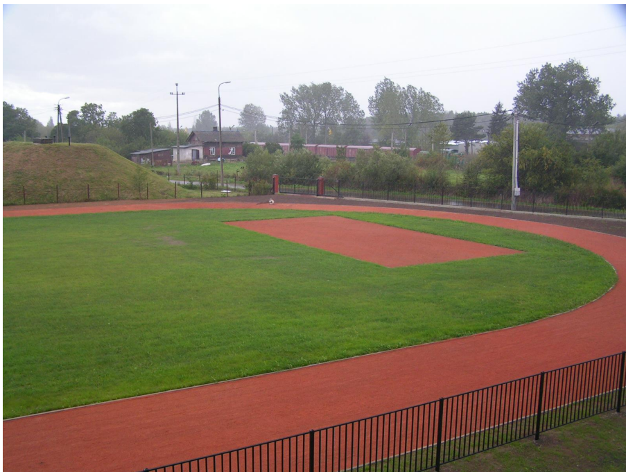
Boisko sportowe przy Publicznym Gimnazjum w Szepietowie

Przy Szkole podstawowej znajduje się boisko trawiaste do piłki nożnej, bieżnia lekkoatletyczna oraz dwa boiska do piłki siatkowej o powierzchni wykonanej z mączki ceglanej.