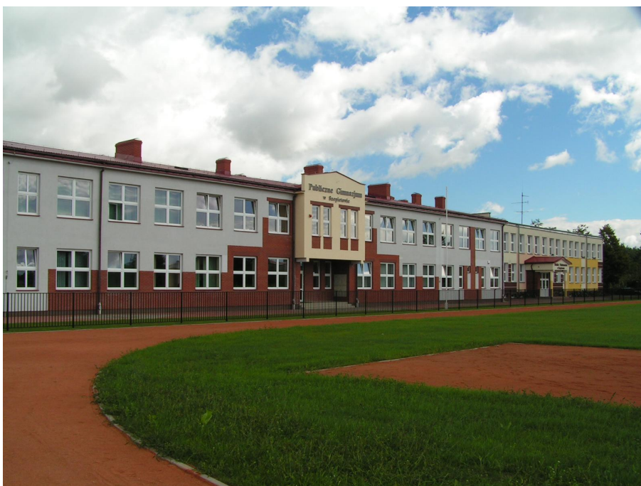
Publiczne Gimnazjum i Szkoła Podstawowa w Szepietowie