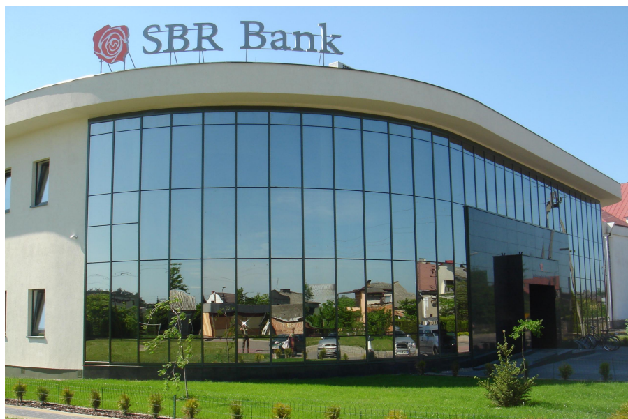
Spółdzielczy Bank Rozwoju w Szepietowie