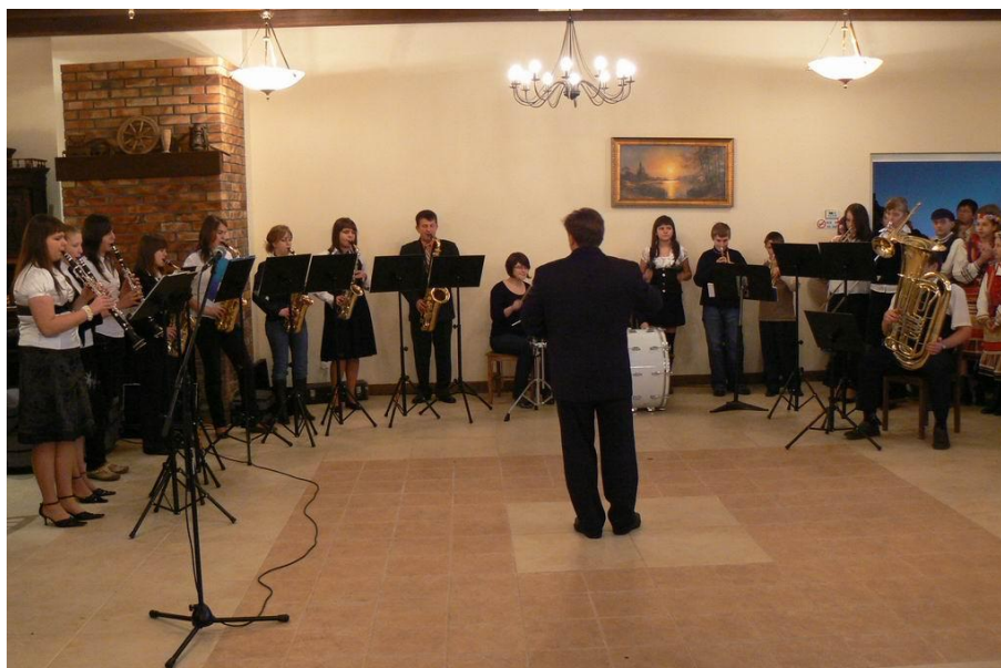
Orkiestra dęta przy GOK w Szepietowie