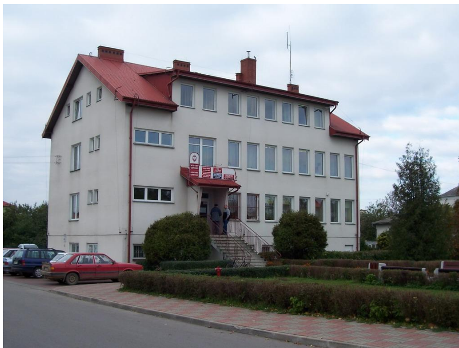
Urząd Gminy w Szepietowie