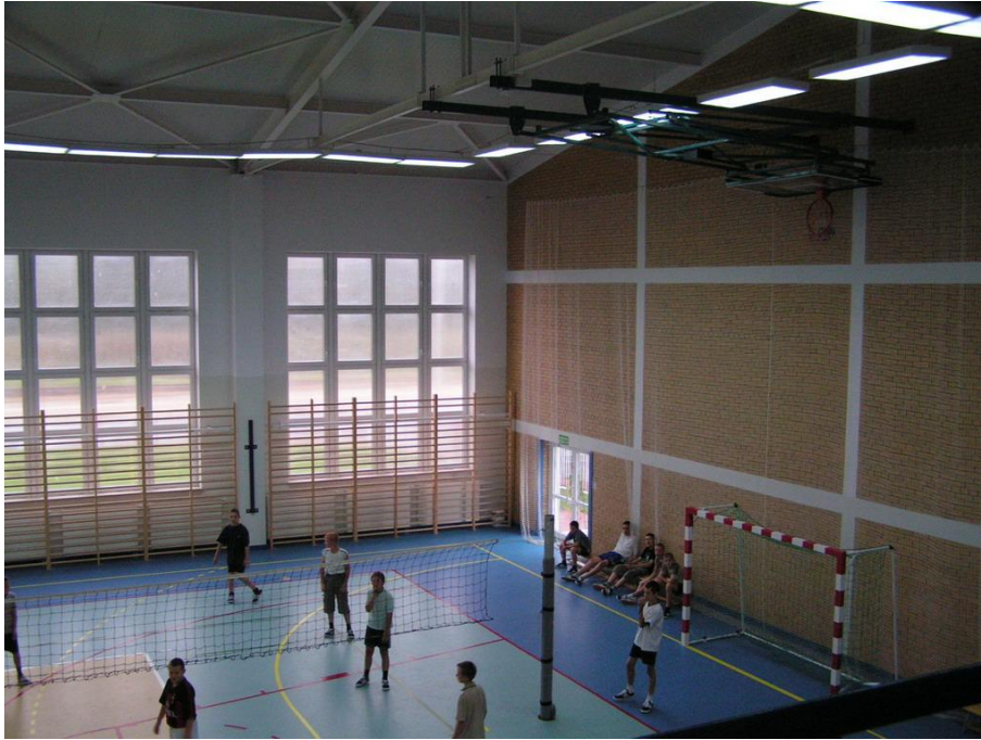
Hala sportowa przy Publicznym Gimnazjum w Szepietowie

Przy Szkole podstawowej znajduje się boisko trawiaste do piłki nożnej, bieżnia lekkoatletyczna oraz dwa boiska do piłki siatkowej o powierzchni wykonanej z mączki ceglanej.