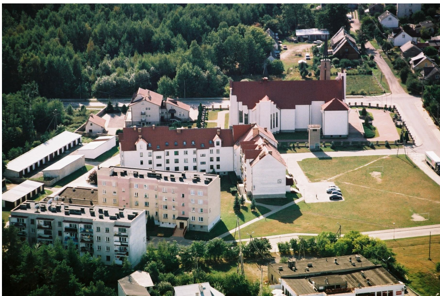
Budynki Spółdzielni Mieszkaniowej w Szepietowie

Obecnie w miejscowości znajduje się 36 ulic. Łączna ich długość wynosi 15.463 m, z czego zdecydowana większość (28 ulic) posiada nawierzchnie utwardzone, bitumiczne. W roku bieżącym kolejne 6 ulic o łącznej długości 1.704 m otrzymają nowe chodniki i jezdnie o nawierzchni bitumicznej, wybudowane w przyjętym do realizacji wniosku w ramach „Narodowego Programu Budowy Dróg Lokalnych”. Wszystkie ulice posiadają sieć wodociągową, oświetlenie uliczne, sieć telefoniczną. W 25 ulicach jest wykonana kanalizacja sanitarna, a w 24 kanalizacja deszczowa. Łączna długość kanalizacji sanitarnej wynosi 11.800 m.