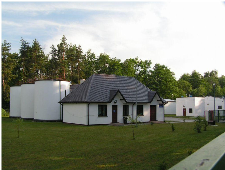
Komunalna oczyszczalnia ścieków w Szepietowie

oczyszczenie ścieków z planowanych do przyłączenia ulic. Miejscowość Szepietowo jest ujęta w Krajowym Programie Oczyszczania Ścieków Komunalnych – aglomeracji powyżej 2.000 RLM.