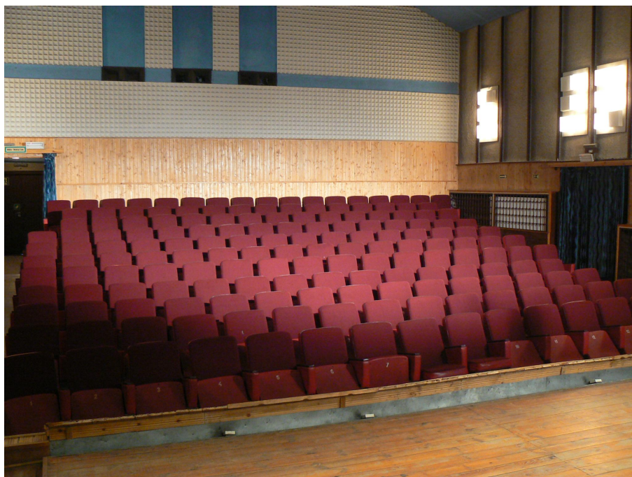
Sala kina „Bajka” w Szepietowie

W graniczącej z Szepietowem miejscowości Szepietowo Wawrzyńce znajduje się jednostka o znaczeniu wojewódzkim, tj. Wojewódzki Ośrodek Doradztwa Rolniczego w Szepietowie. Mimo nazwy ośrodek nie jest zlokalizowany w Szepietowie, lecz administracyjnie należy do pobliskiej miejscowości Szepietowo Wawrzyńce.